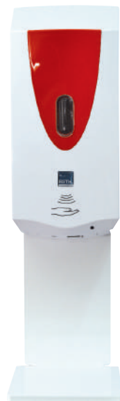
Rot / hochglanzweiß