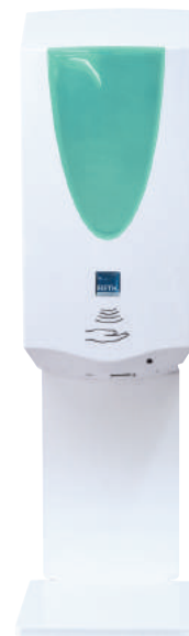
Grün / hochglanzweiß