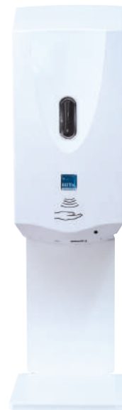
Weiß / hochglanzweiß