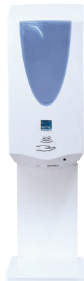
Blau / hochglanzweiß