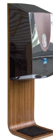
Das Woodline Tisch- und Wandmodell in Chrom und Naturholzoptik. Praktischer abnehmbarer Tropf-Fließ.

Händehygiene mit Stil – die Notouch woodline.X Sensor-Spender bestehen durch Ihre edle Gestaltung in Chrom / Naturholz-Optik / handgeölt. Gerade in Praxen und Labors mit hohen Anforderungen an Design und Funktionalität sind diese Spender gefragt. Die Woodline Spender gibt es als Tisch-, Wand- oder als Standmodell (station)..