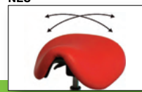
3D Dämpfungselement für alle Saddlechairs (optional)