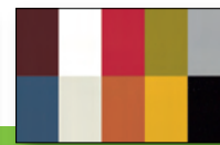
Workchair PIKO: Ultraleather Bezug in 10 aktuellen Farben