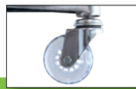
Inline-Rollen für bodenschonendes, leises Gleiten