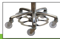
Höhenverstellung durch Fußauslöser (optional)