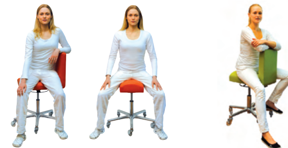
Vielseitiges Sitzen ohne Druck auf die Oberschenkel