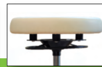
Workchair PIKO: 3D-Sitzen durch Elastomer-Elemente