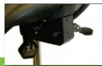
Sitzhöhe + Neigung verstellbar