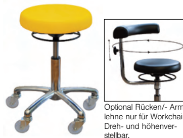
Optional Rücken-/Armlehne nur für Workchair. Dreh- und höhenverstellbar.

bietet neues, dynamisches 3D-Sitzen, Wirbelsäulen- und Beckenbodentraining durch Elastomer-Elemente. Hochwertiger Ultraleather Bezug in zehn modischen Farben, atmungsaktiv, weich und desinfektionsmittelbeständig. Mit Ringauslöser zur leichten Höhenverstellung.